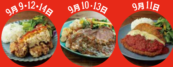
ジャーマンタルタル 唐揚げプレート